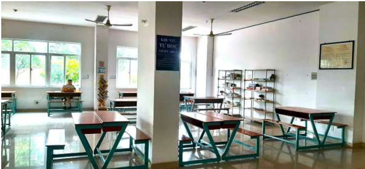
❖ Không gian tự học tại KTX khu B: