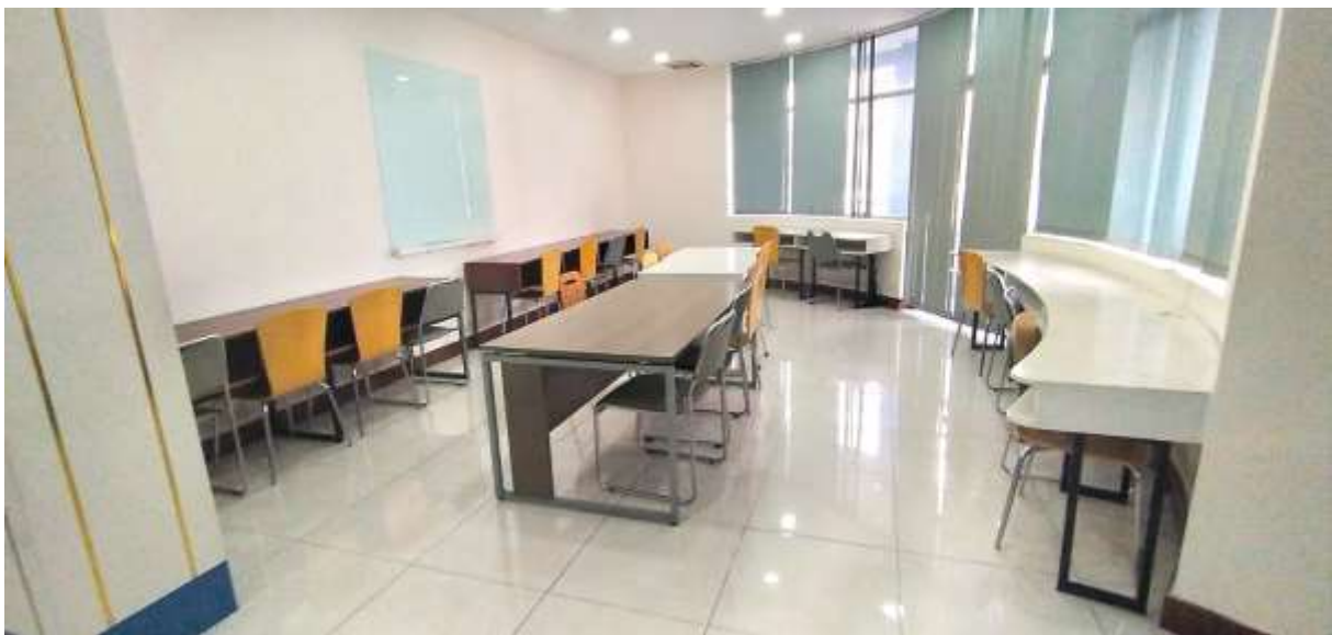
❖ Không gian tự học tại KTX khu A: