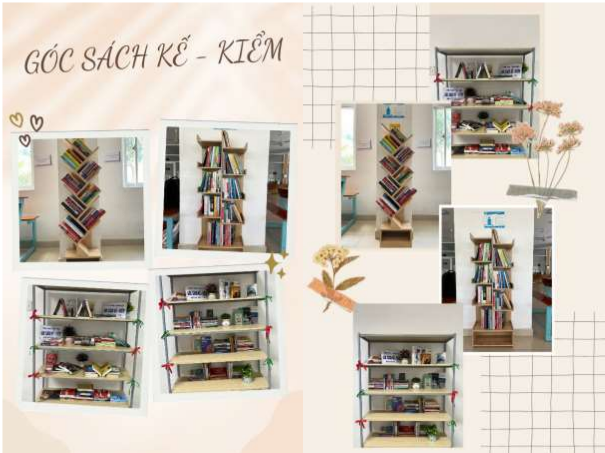
Kệ sách cộng đồng tại khu vực tự học KTX khu B: