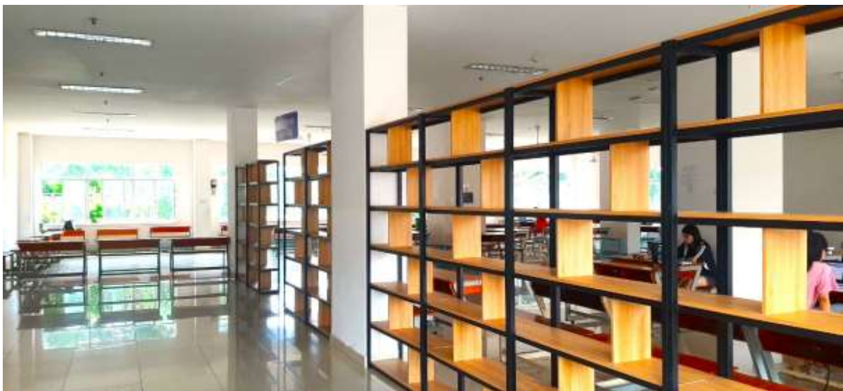
❖ Không gian tự học tại Sảnh Giảng đường C: