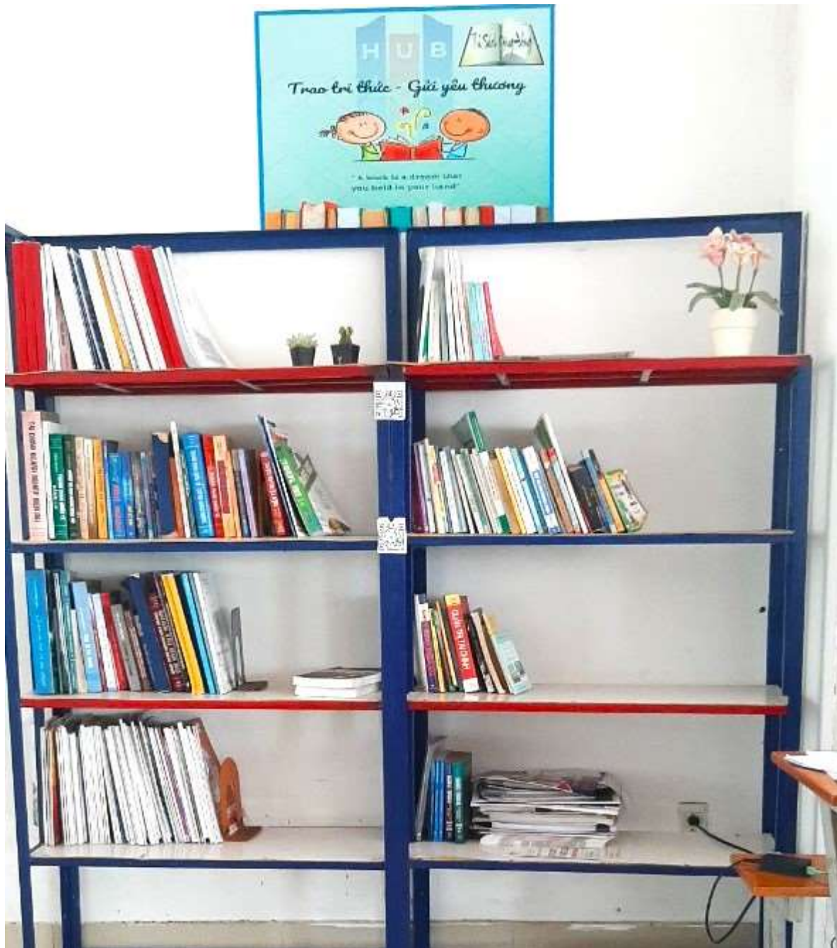
Kệ sách cộng đồng tại khu vực tự học Giảng đường B: